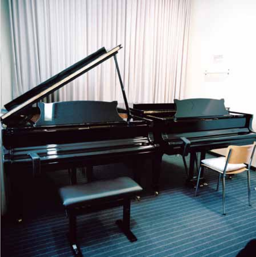
Oben: Jazzcampus Basel, Utengasse 15; unten: Hochschule für Musik Basel, Leonardsstrasse 6.